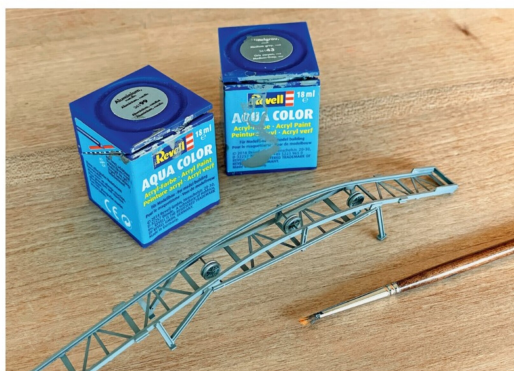
Ausser den silber gefärbten Seilrillen der Rollen wurde die gesamte Konstruktion des Paternosters mit grauer Farbe gestrichen.