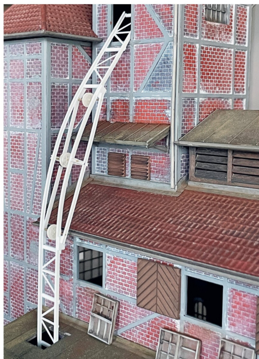
Ob die Konstruktion aus Kunststoffprofilen passte, musste während des Baus mehrmals mittels provisorischer Montage geprüft werden.

braun-schwarze Farbe verlieh dem Metallgestell eine Basisalterung, die nach dem Trocknen zusätzlich mit Pigmentfarben akzentuiert wurde, vor allem mit Rosttönen. Um die Dächer vor herunterfallenden Kohlestücken zu schützen, wurden Bleche auf den Dachziegeln montiert. Sie entstanden aus zugeschnittenen und farblich behandelten Papierstreifen, als Abschlüsse kamen wieder U-Profile zum Einsatz.