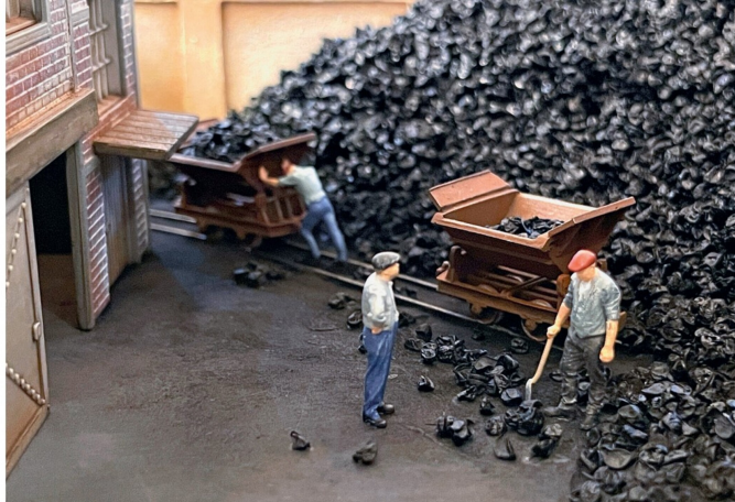
Die Figuren von Modelu beim Kohleschuppen. Ob es sich bei dieser Szenerie um ein Schwätzchen oder gar um eine Rüge handelt, lässt sich allerdings sehr schwer abschätzen.

Die Zeichnung diente danach als Schnittmuster und Klebeunterlage für die U-Profile aus Kunststoff, aus denen die Konstruktion aufgebaut ist. Ich begann mit dem Biegen der Fahrbahnen, was sich als sehr diffizile Arbeit herausstellte. Die U-Profile ließen sich auch nach Erwärmen mit heissem Wasser oder einem Föhn nicht in die gewünschte Form bringen und mussten schliesslich zwischen den Fingern in sehr kleinen Schritten und mit viel Geduld gebogen werden. Trotzdem brachen sie dabei an einigen Stellen, konnten aber immerhin wieder gut verklebt werden. Das Ablängen und Montieren aller geraden Profile war hingegen einfach, wenn auch eine Fleissarbeit. Dank den diagonalen Verstrebungen wird die Konstruktion trotz ihrer Filigranität recht stabil, die Profile und Montageplatten, die den Lift am Gebäudefachwerk stabil verankern, mussten vor Ort abgelängt und angepasst werden. Für die Achsen der