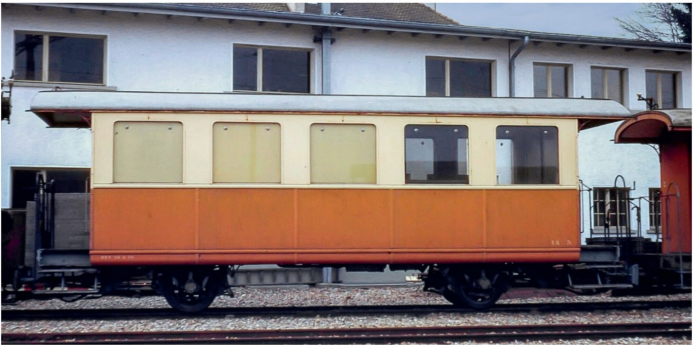
Einer der ehemaligen «Roten» 1972 auf dem Abstellgleis neben dem Depot Langenthal.

Die Beschriftung ist bei diesem Modell relativ bescheiden. Leider fehlen heute die Letraset-Abreibebögen. Für die kleine Waggenummer reichte gerade noch mein Altbestand. Die grossen Nummern auf den Plattformen wurden einzeln in Hellgrau ausgedruckt, von Hand ausgeschnitten, aufgeklebt und mit Mattlack fixiert. Wegen der