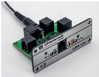
Am hinteren Buchsenstecker wird das Netzteil für die Stromversorgung angeschlossen.