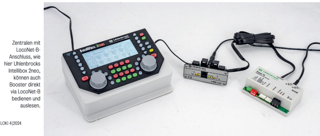
Zentralen mit LocoNet-B-Anschluss, wie hier Uhlenbrocks Intellibox 2neo, können auch Booster direkt via LocoNet-B bedienen und auslesen.