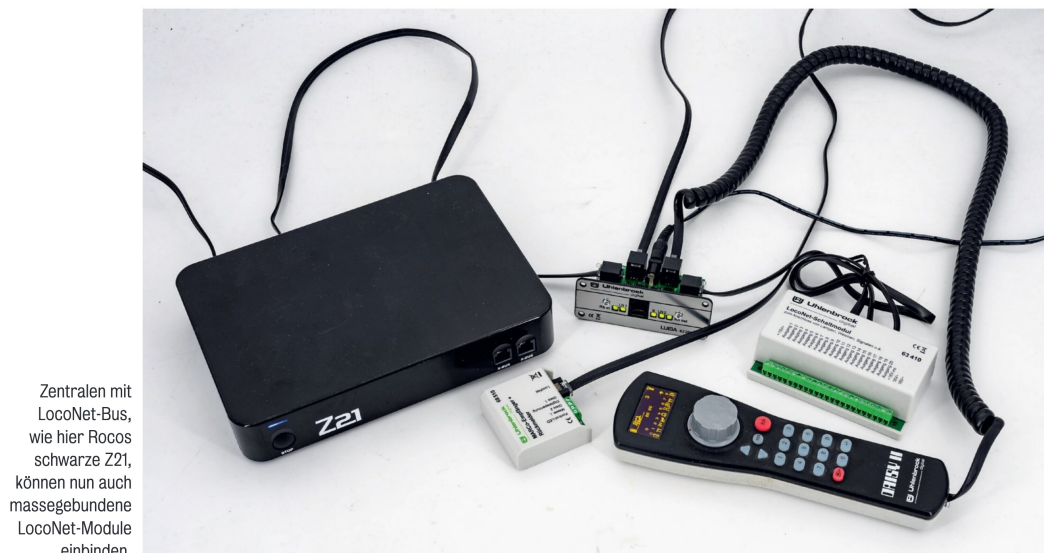
Zentralen mit LocoNet-Bus, wie hier Rocos schwarze Z21, können nun auch massegebundene LocoNet-Module einbinden.