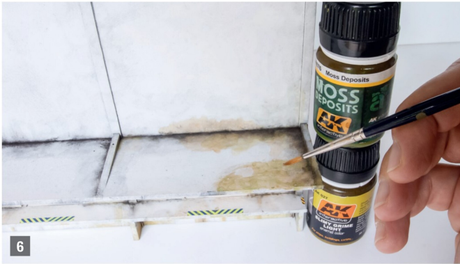
Bild 6: Als letzten Schritt trage ich in den Ecken «Moss Deposits» von AK Interactive (Nr. AK 676) auf. Ich versuche, mit lockerer Hand eine möglichst regelmässige Schicht zu erreichen, und verwende dazu einen mittleren Pinsel und eine zu 50% verdünnte Farbe. Etwas entfernt von den Ecken läuft die Farbe in helleres Moos über (Nr. AK 027).