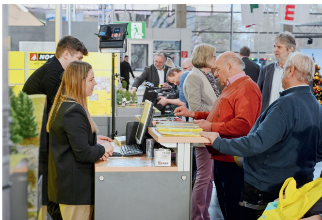
Für ein Bild mit vielen Besuchern musste unser Fotograf viel Geduld und Geschick aufbringen.