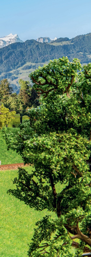
In Sattel ist 1997 die Ae 477 910 der Lokoop mit einem einzelnen Ucs-Zementwagen unterwegs.

Grundsätzlich kommen in diesen Zügen nur Güterwagen zum Einsatz, die handelsüblich von den bekannten Herstellern zu erwerben waren. Sicher etwas unbekannt ist der Kühlwagen der Micarna AG in Bazenheid. Roco stellte diesen Wagen im Jahr 1995 mit der Bedruckung «Bazenheid-Express» her. Auch die Lokomotive DR 250, auch «Von Wartburg» genannt, sieht man selten. Der sächsische Hersteller Gützold verkaufte 2014 diese Lokomotive mit Südostbahn-Beschriftung. Mittlerweile wechselte der Besitzer, aber es werden immer noch Modelle in Zwickau hergestellt, so auch die DR 250. Die BT Be 4/4 ist ein Modell von EMB. Der BT-Triebwagen BDe 3/4 wurde von Sigg Modellbau hergestellt.