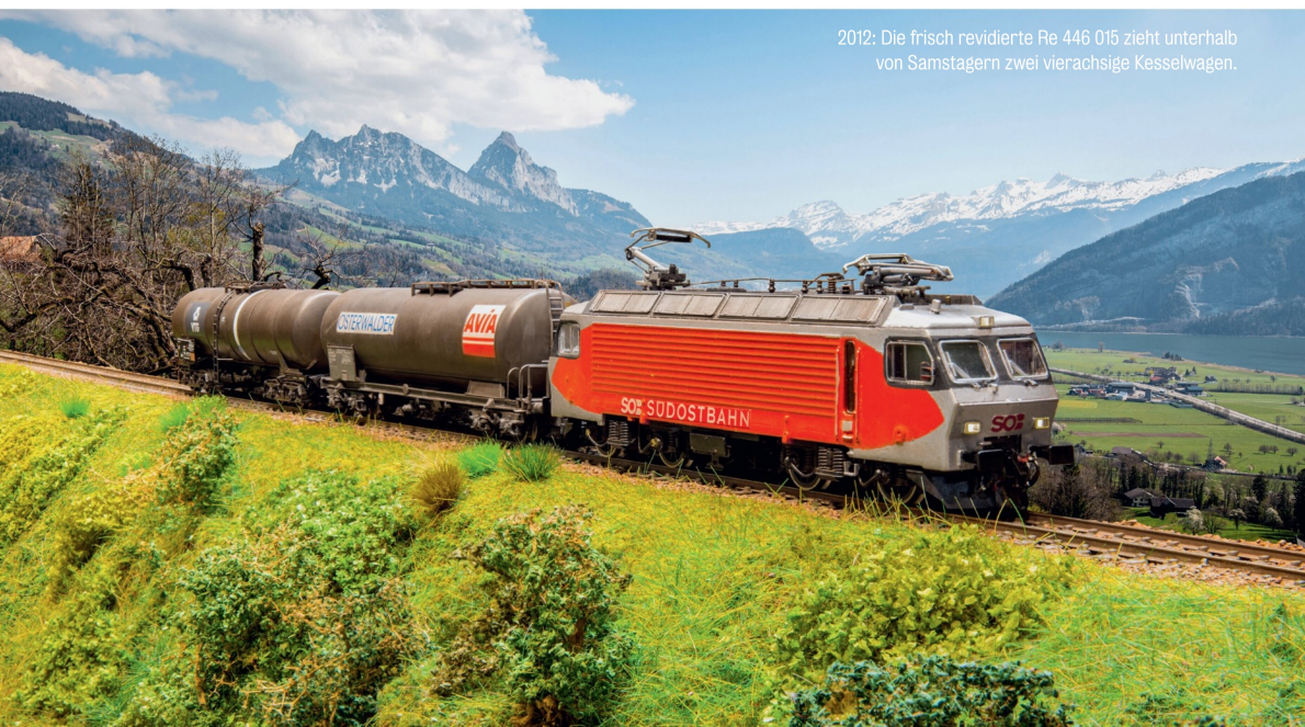
2012: Die frisch revidierte Re 446 015 zieht unterhalb von Samstagern zwei vierachsige Kesselwagen.