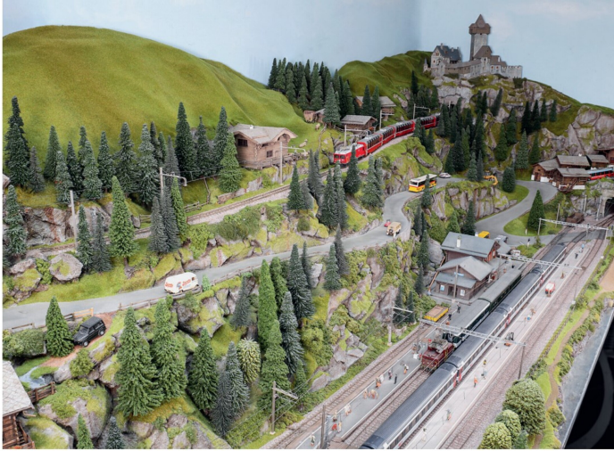
Der Blick auf den rechten Anlagenteil. Oben die Schmalspur, unten die Normalspur samt Bahnhof.

Daler-Rowney-Acrylfarben verwendet und die Farbe hauptsächlich aufgetupft, um eine grobe Textur zu erhalten.