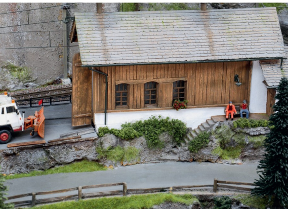
Verdiente Pause für die zwei Bahnbediensteten bei der oberen Remise.