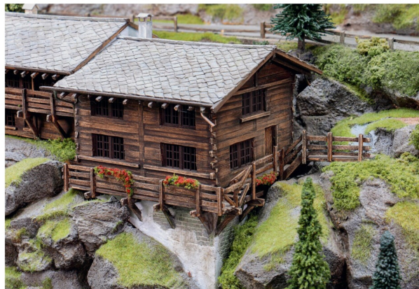
Sowohl die Gebäude als auch ihre Fundamente sind massgeschneidert.