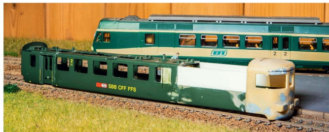
Der Rohbau des Steuerwagens, bevor er zu einem Teil des Globi-Expresses umgebaut wurde.

Eine alte Re 460-Werbelok wird aufgetrieben und neu gespritzt. In den Farben von Globis Schnabel (Gelb und Orange) wird die Front gespritzt. Der Globi-Verlag stellt grosszügigerweise ein paar Bilder für diesen Umbau zur Verfügung. Die seitliche Beklebung wird auf dem Computer gestaltet und auf eine A4-Etikette gedruckt. Diese Folie wird anschliessend auf die Lok geklebt. Nun fehlen aber noch passende Wagen. Die SBB stellen einen bald ausgedienten EW IV zur Verfügung. Dieser wird mit Globi-Figuren beklebt. Als Abschluss erhält er oben noch einen schwarz-roten Streifen. Nun beginnt die Suche nach einem passenden Steuerwagen. Auf seinem Weg durch die Schweiz wird der Zug öfter die Richtung