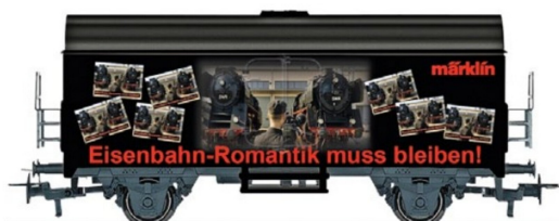
Der Sonderwagen von Märklin weist zwei unterschiedliche Seiten auf.