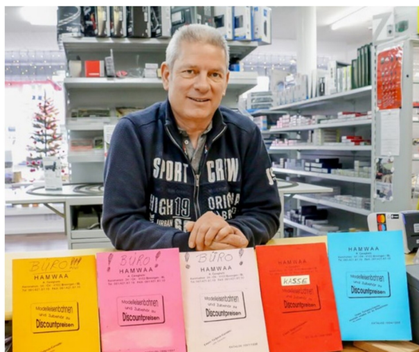
Weit über die Region Basel hinaus bekannt waren die Hamwaa-Preislisten, in denen...