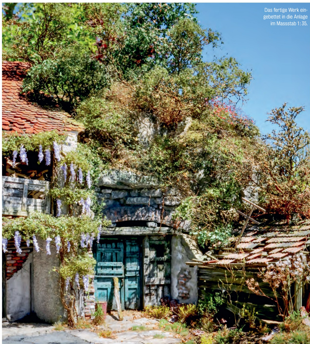
Das fertige Werk eingebettet in die Anlage im Massstab 1:35.