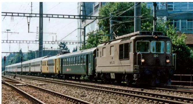
Bei der Durchfahrt des IC 335 in Gümligen zeigt sich hinter der Lok der Verstärkungs-EW I.

Die aufgeführten Zugskompositionen zeigen, wie vielfältig der Einsatz des «Chäs-Express» in seiner kurzen Zeit war, wobei die Mitropa-Varianten nicht berücksichtigt sind. Wir hoffen nun, Ihnen mit diesem kurzen und abwechslungsreichen Überblick einige Anregungen geben zu können, um noch mehr Spass mit Ihren Modellzügen zu haben. Und vielleicht haben Sie inzwischen auch Lust auf ein Fondue? 🍷