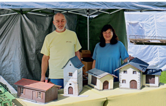
Bei Große-Modelle gibt es verschiedene Bündner Hochbauten.