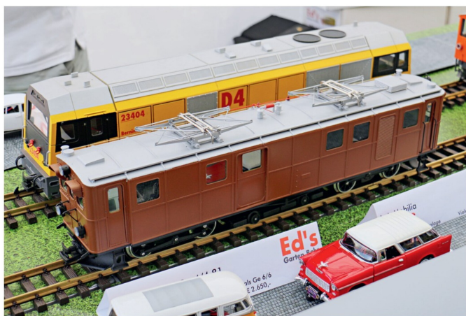
Das Muster der RHB Ge 6/6 81 von Ed's Gartenbahn blieb bisher ein Einzelstück.

bahnhersteller Innolutions angereist, der in Eschershausen einen Einblick in die Produktpalette seiner Schweizer Fahrzeuge gab. Darunter war auch die überarbeitete Variante des Bernina-Krokodils Ge 4/4 182, das nun mit einer neuen Lackierung in korrekten Brauntönen produziert wird. Für den noch jungen Gartenbahnproduzenten ist Eschershausen eine wichtige Plattform, um die Bekanntheit im Markt weiter zu steigern. Viele Zubehörteile zur Modifikation von Grossserienmodellen, auch, aber nicht nur nach Schweizer Vorbild, bietet Christian Fesl. Der junge Gartenbahner hat mittlerweile ein breites Angebot an lackierten und einbaubereiten Teilen lieferbar. Von passenden Puffern über neue Inneneinrichtungen und Lampen bis hin zu Schutzkappen und Schiffchen für die Stromabnehmer findet sich im Sortiment so ziemlich alles, um bestehende Modelle weiter aufzuwerten. Kein