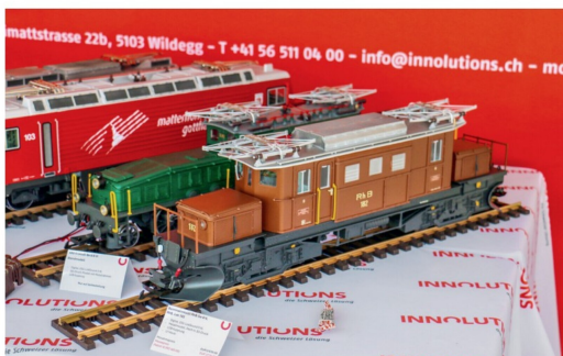
Innolutions hat die Ge 4/4 182 der RHB überarbeitet und ausgeliefert.