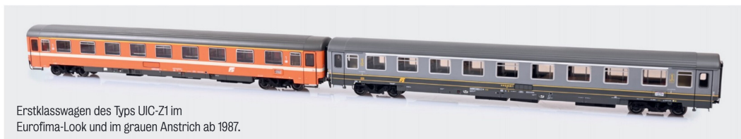
Erstklasswagen des Typs UIC-Z1 im Eurofima-Look und im grauen Anstrich ab 1987.