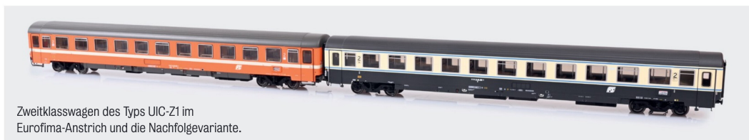
Zweitklasswagen des Typs UIC-Z1 im Eurofima-Anstrich und die Nachfolgevariante.

Mit den drei Anstrichvarianten der italienischen Schnellzugwagen sorgt der EuroCity MonteVerdi für einen abwechslungsreichen und interessanten Farbtupfer auf der Modellanlage.