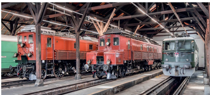
In Erstfeld ist das Zentrum der Gotthard-Bahntage, auch das alte Depot kann man besichtigen.

Das Team Erstfeld und SBB Historic organisieren am Samstag, 13., und am Sonntag, 14. September, jeweils zwischen 9 und 17 Uhr die Gotthard-Bahntage. Auf der Gotthard-Nordrampe finden Erlebnisfahrten mit der C 5/6 und der Ce 6/8 II statt. Beim Halt in Göschenen besteht die Möglichkeit, die Modelleisenbahnanlage der IG Gotthardbahn im Massstab 1:87 zu besichtigen. Bei den Gleisanlagen vor dem Depot Erstfeld ist eine Fahrzeugausstellung geplant. In der ehemaligen Dampfremise wird den Besuchern die Geschichte der Bergstrecke