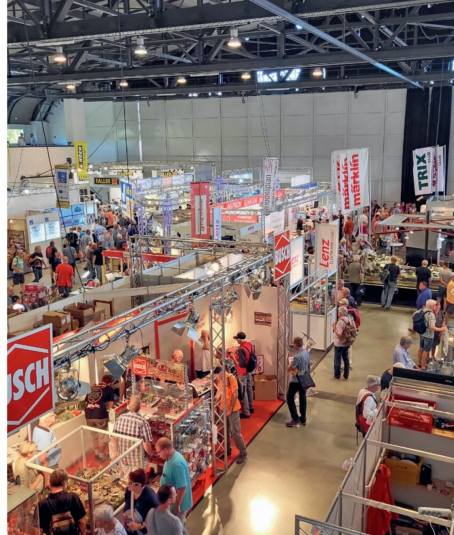
An der IMA stellen über 130 Aussteller an fünf Standorten aus.