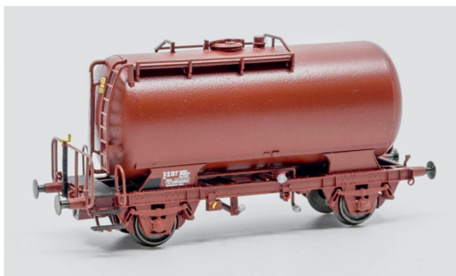
Das Endprodukt darf sich durchaus sehen lassen.