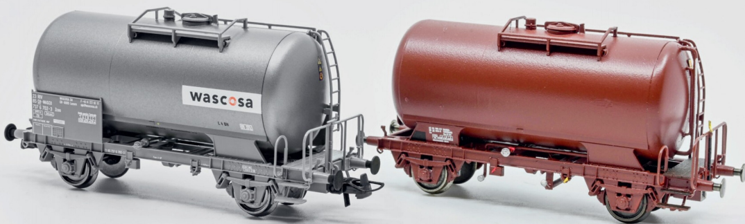
Der Unterschied ist deutlich: links das Ausgangsmodell von ROCO und rechts der fertig umgebaute Wassertankwagen von Franz Scherer.