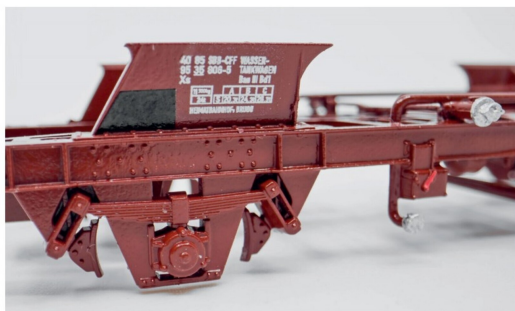
Die Beschriftung wurde sauberlich mittels eines Decals aufgebracht.