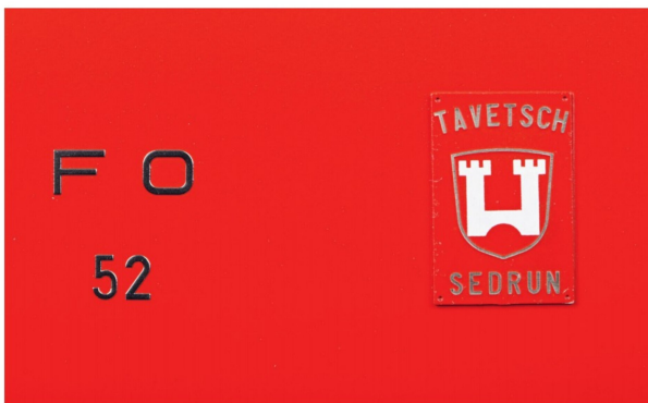
Auch die Beschriftung lässt keine Wünsche offen. Die Wappen sind geätzt.

Die fünf verschiedenen Varianten des Deh 4/4 von FO, BVZ und MGB auf einen Blick.