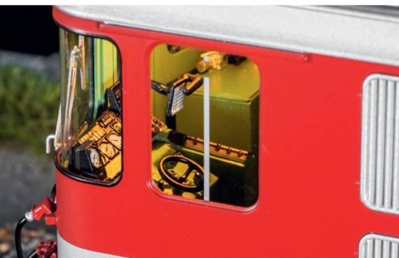
Auch im Führerstand fehlt es an nichts. Das Licht reagiert auf Tastendruck.