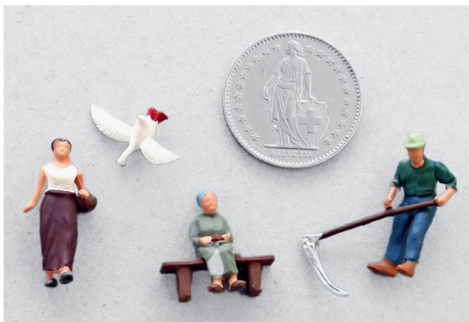
Oben abgebildet sind die sechs mitgelieferten Bauernhoffiguren mit den drei Gänsen.