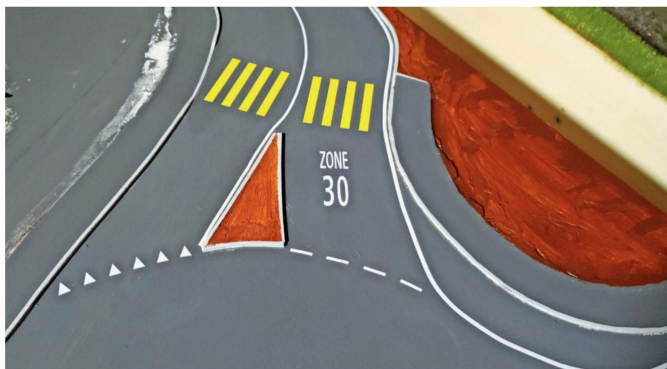
Das fertige Resultat kann sich sehen lassen und verleiht der Anlage einen Hauch von Realität.