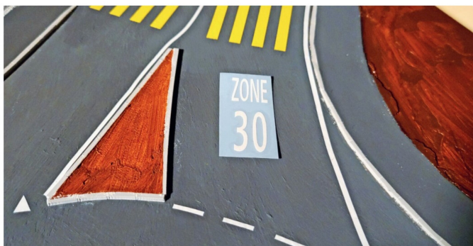
Nach dem Andrücken des Markierungsbogens muss nur noch die Trägerfolie entfernt werden.

die Strasse gehen können, sind auch Fussgängerstreifen erhältlich. Auch orange Markierungen für Baustellenbereiche zählen zum Sortiment von mobax.de .