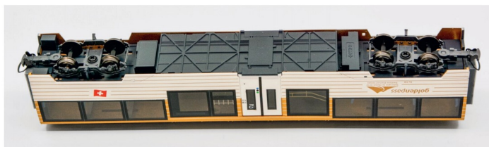
So sollte man den Wagen nicht auf der Anlage sehen. Blick auf den Unterboden des Bs 236.

in der ausgezogenen Variante dargestellt, sodass der Wagen im Zugverband mitlaufen kann. Wie sich der Wagenkasten vom Untergestell lösen lässt, bleibt dem Autor vorerst ein Rätsel. Trotz Abziehen der Faltenbälge, Abschrauben der Drehgestelle und dem Einsatz vieler Zahnstocher liess sich der Wagenkasten an den Stirnfronten nicht bewegen. Hier könnte BEMO vielleicht helfen und mitteilen, wo genau die Klickraster sind.