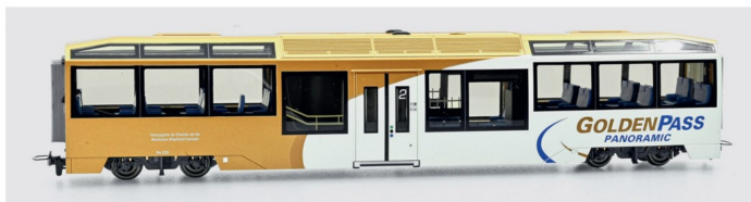
MOB Bs 236-Niederflrwagen GoldenPass Panoramic (Art.-Nr. 3299 346).