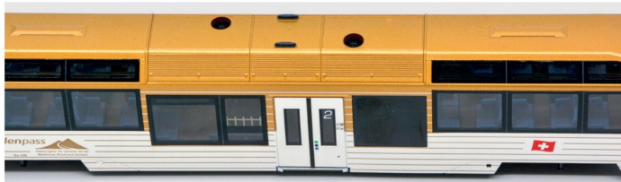
Von oben ist auf dem Dach auch die gut versteckte Klimaanlage in der Wagenmitte zu erkennen.