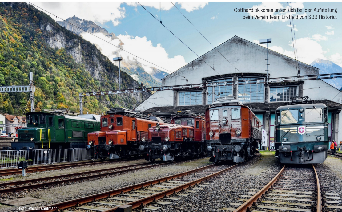
Gotthardlokomotoren unter sich bei der Aufstellung beim Verein Team Erstfeld von SBB Historic.

Der ABDe 6/6 31 als stündlicher Hinketakt-Zubringerzug von Locarno nach Ponte Brolla und zurück.