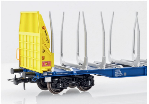
Auch die Stirnseite der GigaWood-Wagen ist detailreich gestaltet.

Im Bereich der fixen Kupplung finden sich unter dem Wagenrahmen auch die Lufttanks und die Nachbildung der Bremssteuerung.