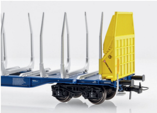
Wenn man es weiss, sieht man es, das Logo von Swiss Krono am Wagen.