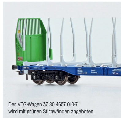
Der VTG-Wagen 37 80 4657 010-7 wird mit grünen Stirnwänden angeboten.

Folgende Modelle werden von Sudexpress bis zum Jahresende ausgeliefert: