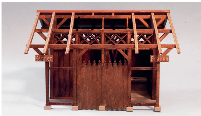
Die Schilder oberhalb der Schamwand kennzeichnen das Gebäude klar als Toilettenhäuschen.