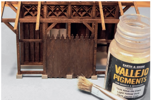
Die Wände erhalten mittels Pulverfarben eine sanfte Verwitterung.