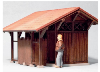
Dagegen bleibt das grössere Schleppdach links abnehmbar und ist nur lose aufgelegt.

des Bausatzes begeistert den Erbauer sehr schnell. Angesichts dieser faszinierenden Detailqualität stellt sich dem Besitzer des Modells dann aber auch die entscheidende Gewissensfrage: Wenn das Dach am Ende aufgeklebt ist, sehe ich viele dieser zierlichen Details doch gar nicht mehr; reicht mir das blossе Wissen um ihre Existenz denn aus? In Beantwortung dieser Frage reifte der Entschluss, das grössere Dachteil abnehmbar zu gestalten und die Dachkonstruktion sowie das anschauliche Innenleben des Gebäudes mit seinen schönen Details dem Betrachter zum Beispiel in