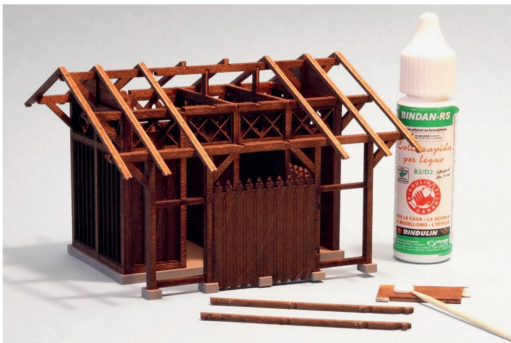
Die mittleren Dachsparren sind bewusst ausgelassen worden.