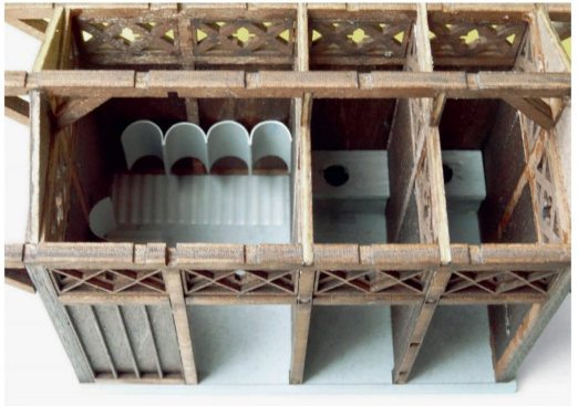
Bei offenem Dach lassen sich die Toiletteneinbauten gut erkennen.