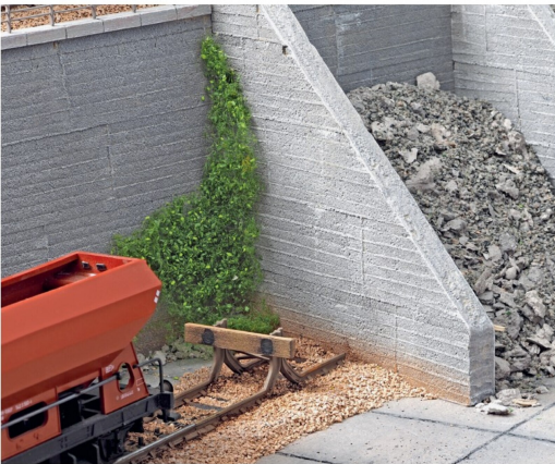
Der fertige Prellbock leichter Bauart ohne untere Gleisverbindung.