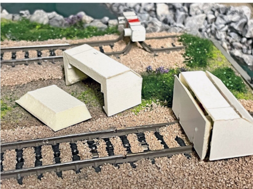
Die Betonprellböcke werden an gut zugänglichen Stellen angepasst.