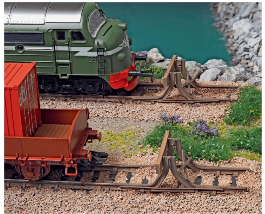
Diese Prellböcke in der Ansicht von hinten verdeutlichen die X-Versteifung.