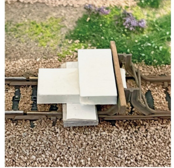
Zur Montage wird eine Lehre konstruiert, Zweikomponentenleim schafft die Verbindung.