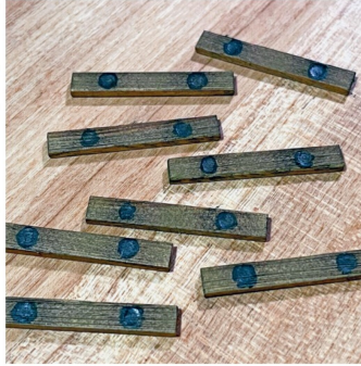
Die Holzbohlen entstehen aus gealterten Holzprofilen, die fettigen Stellen sind obligatorisch.