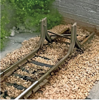
An schwerer zugänglichen Stellen wird auf die unteren Gleisverbindungen verzichtet.