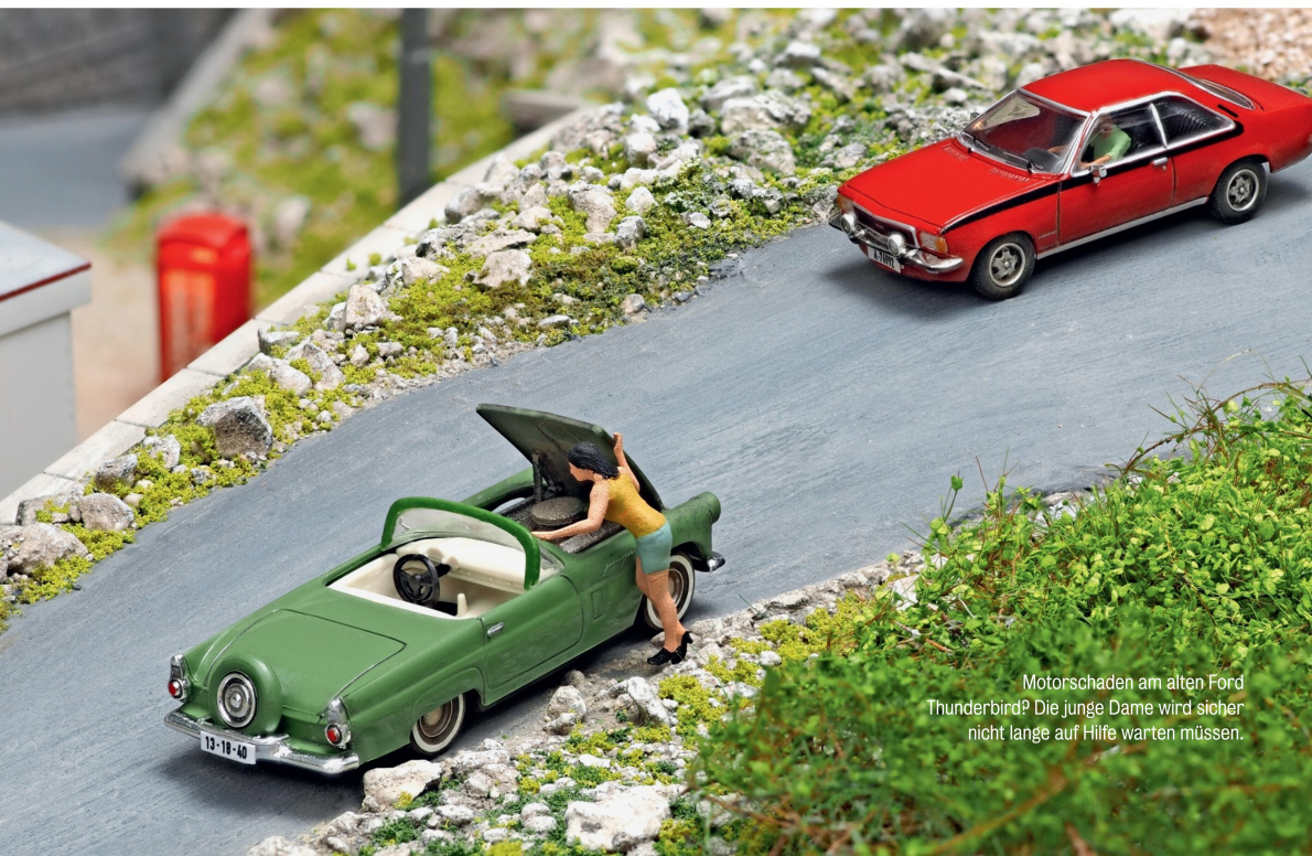
Motorschaden am alten Ford Thunderbird? Die junge Dame wird sicher nicht lange auf Hilfe warten müssen.