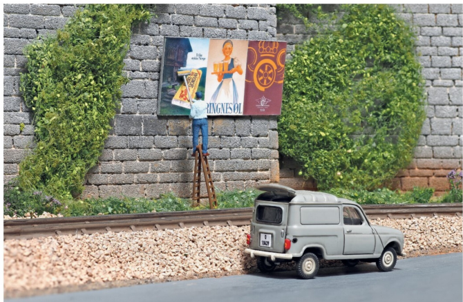
Der Plakatkleber von Busch und der Renault R4 von Wiking lassen sich optimal kombinieren.

Wiking kombinieren. Dieses Handwerkerauto passt ausgezeichnet, wurde es von Wiking doch extra mit funktionierender hinterer Dachluke ausgestattet, die den einfachen Transport von Leitern ermöglicht. Die Leiter, auf welcher der Plakatkleber nicht gerade Suva-konform seine Arbeit verrichtet, gehört denn auch zum Lieferumfang des R4.