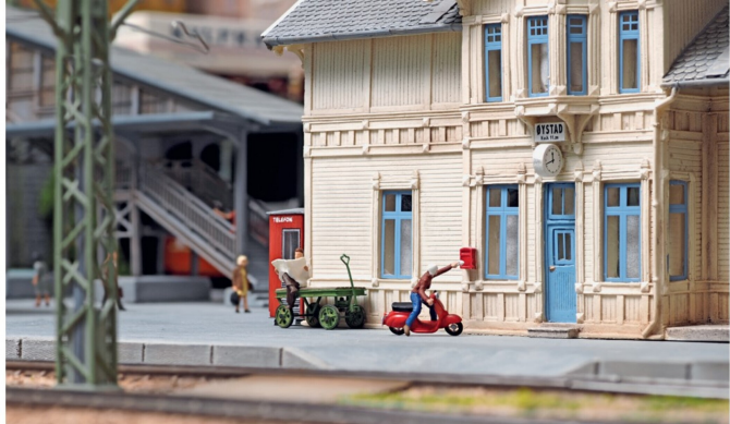
Der Brief muss wichtig sein, wie die dynamische Stellung des Rollerfahrers errahnen lässt.