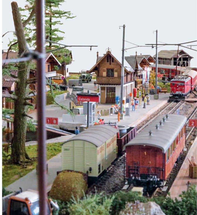
Der Bahnhof Calanda mit zwei Gleisen und einem Depot als Endstation der BVZ-Strecke.

MBA, der Werkstatt des aussergewöhnlichen Künstlers Enrico Pirovino, und PR Modellbau. Ich achte sehr auf die Details. Es ist daher nicht verwunderlich, dass man auf meiner Anlage patinierte Fahrzeuge mit Zuglaufschildern findet.