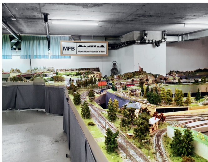
Blick in das Vereinslokal der Modulbau-Freunde Basel mit den beiden H0- und H0m-Anlagen.

Bei den MFB gehören die Module dem jeweiligen Erbauer. So kann sich jeder seinen Anlagenteil einfach oder reichhaltig, je nach seinem Geschmack und Geldbeutel, ausschmücken. Der Verein stellt die Infrastruktur zur Verfügung. Dazu gehören das Vereinslokal, die Werkstatt und einige Werkzeuge. Auch die Metallstützen, welche