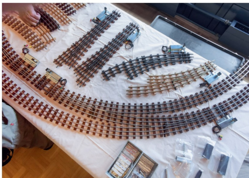
Grosse Radien und schlanke Weichen für BUCO von Peter Wülser.