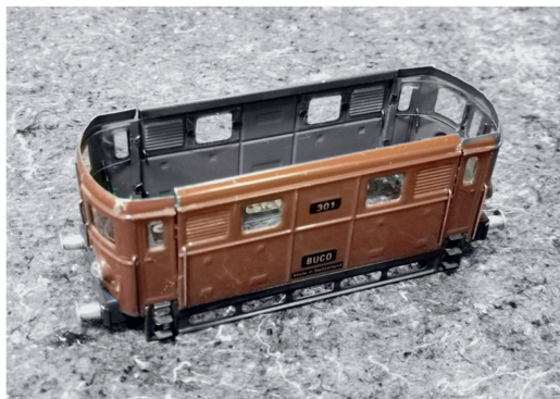
Alte Gehäuse erhalten bei der BUCO Spur 0 GmbH ein neues Innenleben.