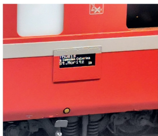
Ein voll funktionierender digitaler Fahrtzielanzeiger an einem EW IV von Lematec in Spur 0m bei Binario Uno aus Samedan.

wieder komplettiert und funktionsfähig hergerichtet. Damit die BUCO-Loks auch auf entsprechenden Schienen mit schönen, grossen Radien verkehren können, stellt die Firma BUCO Schienenbau-System von Peter Wülser aus Wolhusen diese wieder her. Angeboten werden Schienen mit einem Radius von 180 und 200 cm sowie die dazu passenden schlanken Weichen. Beide Firmen haben eine grosse Auswahl an BUCO-Fahrzeugen, Originalersatzteilen und Zubehörteilen wie Lampen, Signalen und Wagenbeleuchtungen, manchmal auch gebraucht.