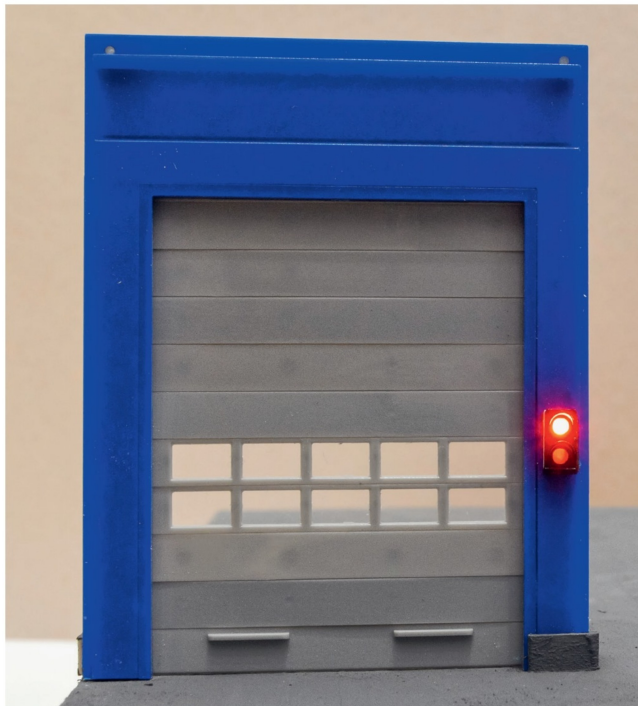
Halt: Die Ampel wie auch das Viessmann-Rolltor können digital angesteuert werden.