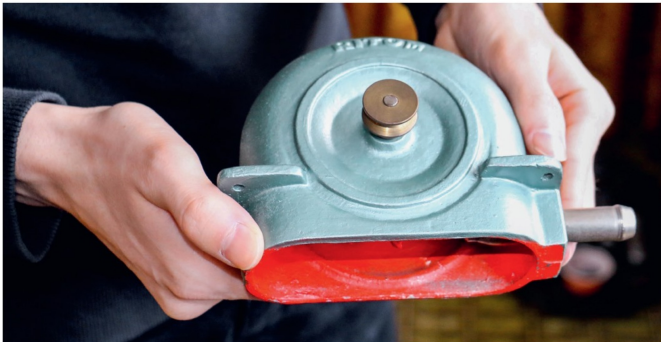
Eine Ritom-Turbine, mit der selbst Strom für den Antrieb der Bahn produziert werden konnte.