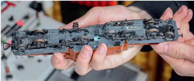
Das Fahrwerk des Wesa-Krokodils. Trotz ihrem Alter fährt die Lok tadellos.