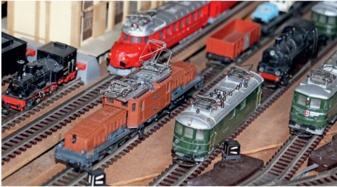
Parade diverser Lokomotiven der Wesa, unter anderem mit dem Roten Pfeil und dem Krokodil.