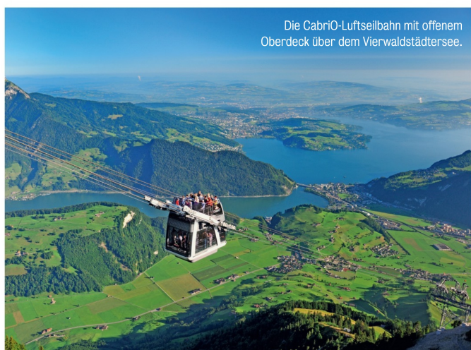
Die CabriO-Luftseilbahn mit offenem Oberdeck über dem Vierwaldstättersee.