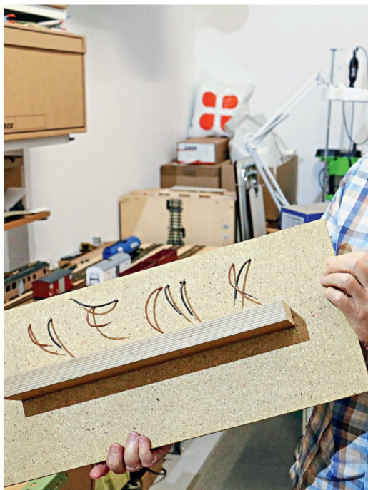
Hier ist das Beispiel der Verdrahtung eines Segments zu sehen.