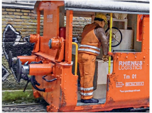
Das Lokpersonal habe ich im Sortiment der Firma Noch gefunden.