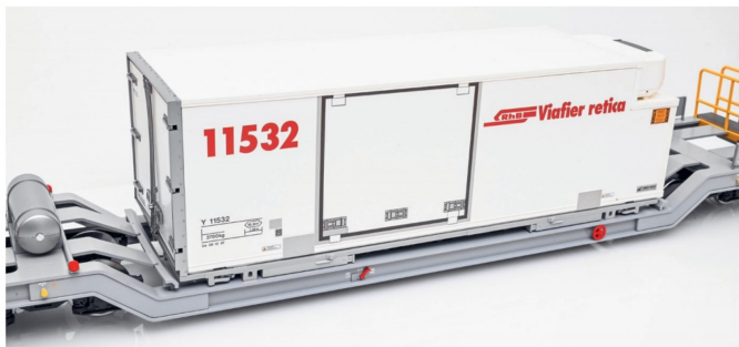
Beim genauen Hinschauen erkennt man, dass die seitliche Schiebetür lediglich aufgedruckt ist.