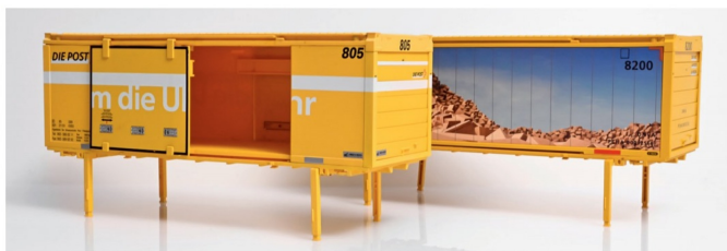
Vorne ein älterer LGB Post-Container, hinten der neue Container ohne das Schiebetor.