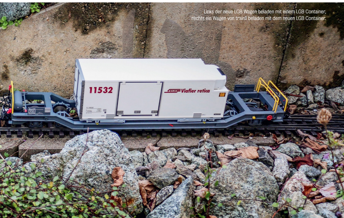
Links der neue LGB Wagen beladen mit einem LGB Container, rechts ein Wagen von trainli beladen mit dem neuen LGB Container.