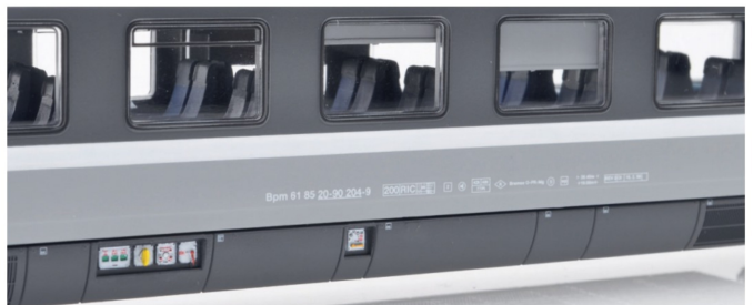
Lupenreine Anschriften und mehrfarbige Brems tafeln auf der Seite des Modells.