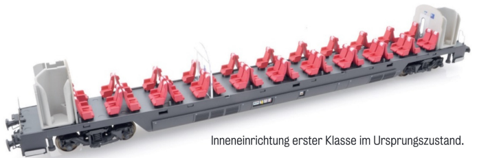
Inneneinrichtung erster Klasse im Ursprungszustand.

Die Modelle werden in der weitbekannten grauen und schlicht gestalteten LS-Models-Verpackung geliefert. Ein passgenau zuge-