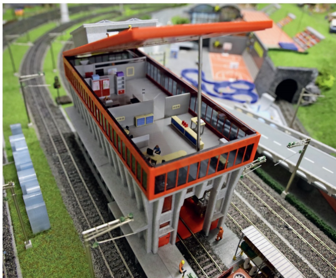
Das Bürodach wurde nicht verklebt, damit der Zugriff auf die Inneneinrichtung möglich bleibt.