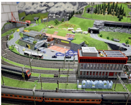
Dank 3-D-Technologie ist der vorhandene Platz exakt passend ausgefüllt.