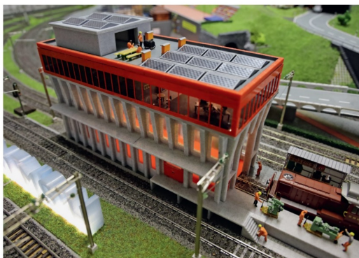
Die eingebaute Beleuchtung erwies sich für die Fotos als sehr praktisch.