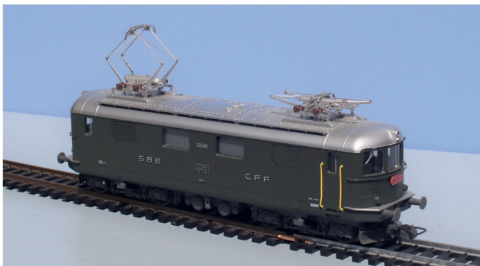
Schlussendlich kündigte Lima noch die Überarbeitung der Re 4/4 1 an. Dabei wurden auch Lokomotiven der ersten Serie angeboten. Die Auslieferung der Modelle erfolgte ab 1994.