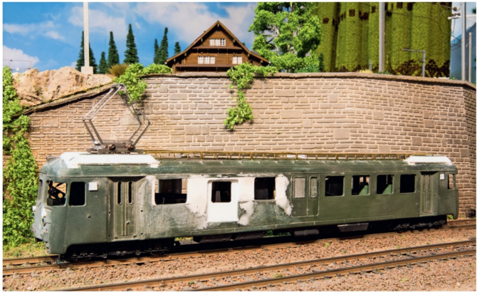
Der Triebwagen ist im Rohbau fertiggestellt, gespachtelt und bereit für die Spritzerei.