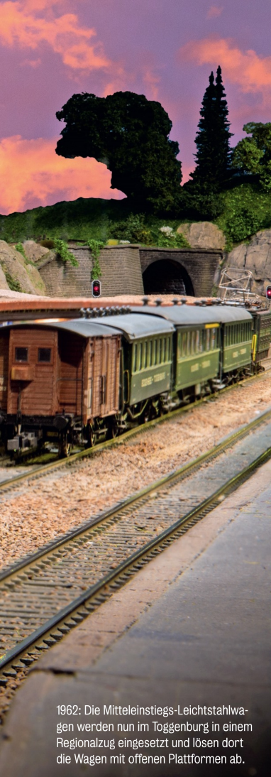
1962: Die Mitteleinstiegs-Leichtstahlwagen werden nun im Toggenburg in einem Regionalzug eingesetzt und lösen dort die Wagen mit offenen Plattformen ab.