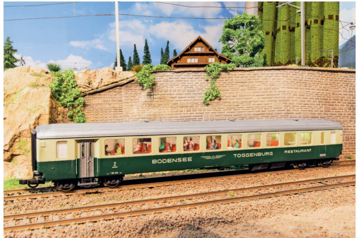
Der Speisewagen unterscheidet sich nicht gross von einem herkömmlichen Zweitklasswagen.

Im Gegensatz zum WR 451 besitzt der hier abgebildete WR 450 keine Bartheke.