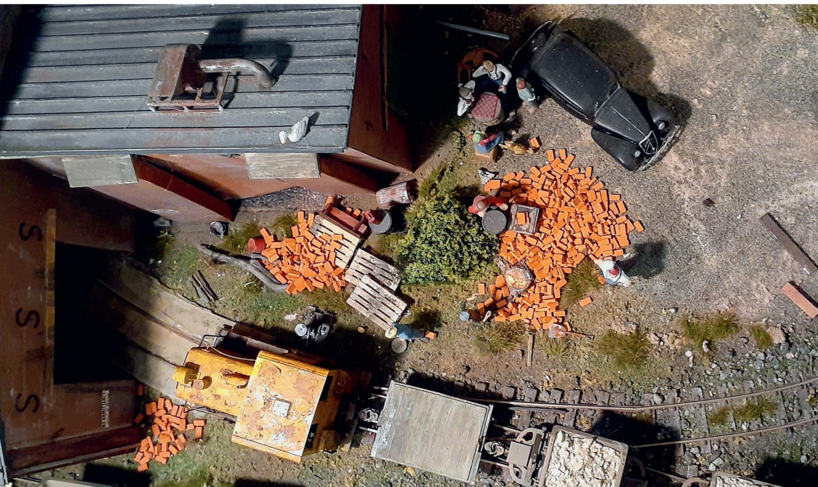
Der Feldbahnzug verschwindet sogleich brummelnd im Ziegelei-Hauptgebäude und gelangt so hinter die Hintergrundkulisse.

Die Strecke im vorderen, sichtbaren Bereich besteht aus On30-Schienen von Peco On30, während im Schattenbereich «hinter den Kulissen» gewöhnliche H0-Schienen und eine Code-100-Weiche von Peco in Spur 00 verwendet wurden.