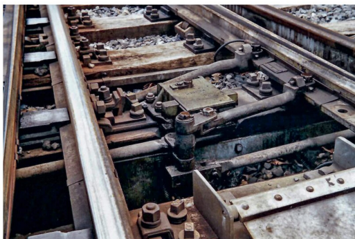
Die zwei Gelenkstücke mit der Schwinde dazwischen aus naher Sicht.