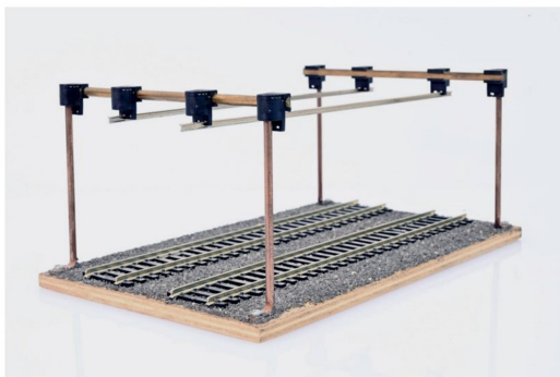
Auch das Tunnel-Oberleitungssystem Mader ist made in Gälterchinde.