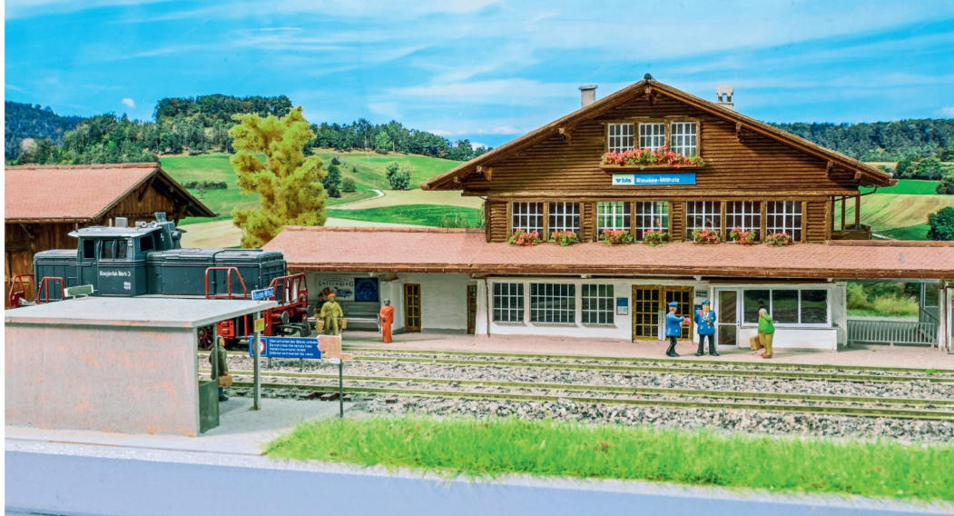
Das FIDES-H0-Modell des Bahnhofes Blausee-Mitholz an der Lötschberglinie der BLS ist ein Klassiker im Sortiment des Hobby-Shops.