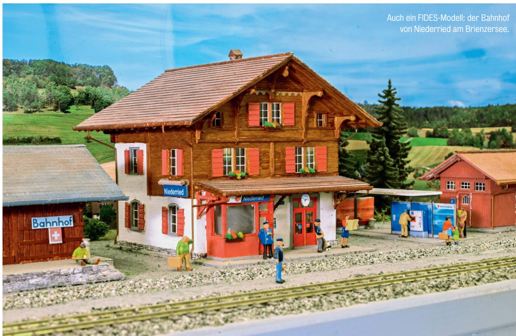
Auch ein FIDES-Modell: der Bahnhof von Niederried am Brienzersee.