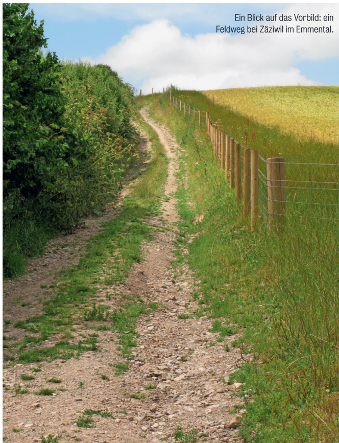
Ein Blick auf das Vorbild: ein Feldweg bei Zäziwil im Emmental.