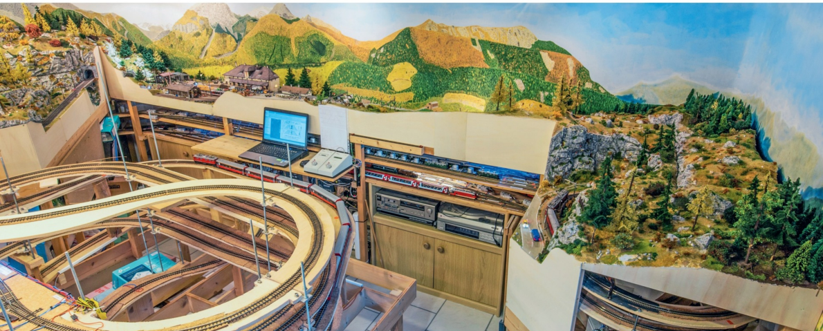
Überblick über die beiden neuen Anlagenteile: links der Teil «Bahnhof Bergün», rechts der anschließende Teil «Bergünenstein».