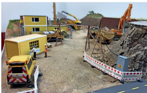
Der Baustrom wird über eine Kabelbrücke zur Baustelle geführt.