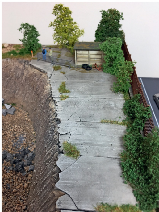
Zwei Pensionäre begutachten aus sicherer Entfernung die Abrissarbeiten.