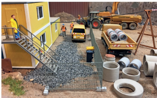
Die Arbeiter leben zum Teil in Wohncontainern auf der Baustelle.