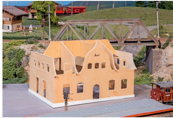
Das Dienstgebäude ist nun im Rohbau fertiggestellt.