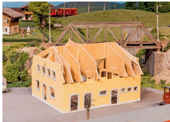
Der Dachaufbau ist verfeinert, und die Wände haben ihren Anstrich.