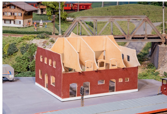
Die Fassadenwände sind inzwischen mit Schleifpapier überzogen.