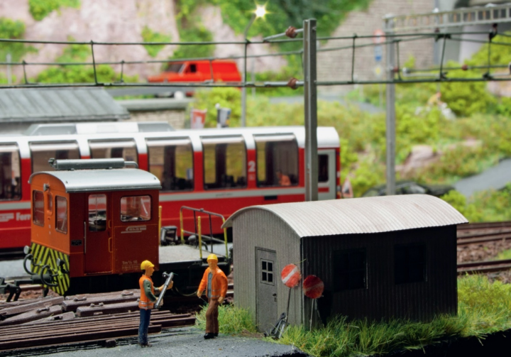
Ein RhB-Rangiertraktor Tm 2/2 16 neben der Bauhütte, davor zwei Gleisarbeiter.