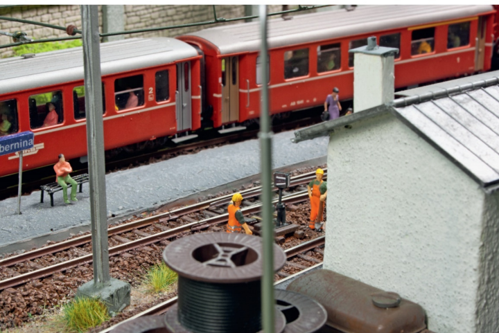
Zwei Gleisarbeiter reparieren eine Weichenlanterne zwischen Gleis 2 und dem Ausziehgleis.

steuern sollen. Im Schattenbahnhof ist ein halbautomatischer Zugswchsel möglich. Die Belegung der zwei Hauptgleise wird von LEDs angezeigt.