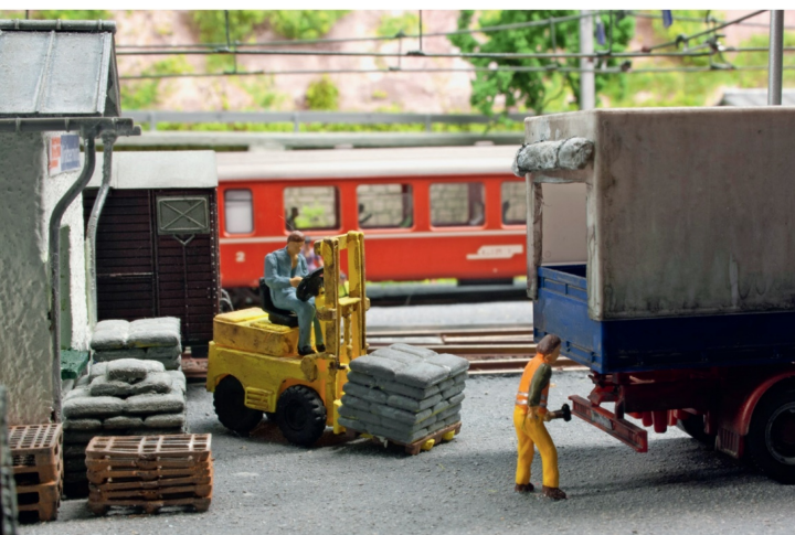
Ein Gabelstapler sorgt für die Verladung der Güter vom Zug auf die Lkw.