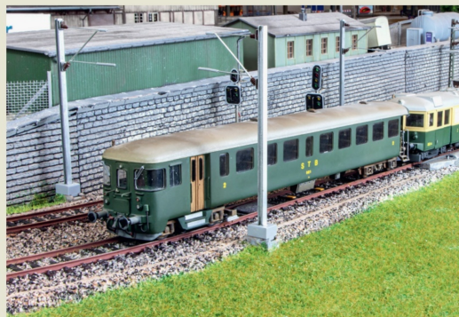
Der Bti 201 verkehrte immer zusammen mit einem Be 4/4-Triebwagen.