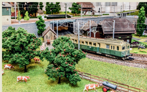
Der BDe 2/4 101 ist für einmal als Einzelfahrer unterwegs.

Das ist der grösste Dampftriebwagen für den Modelleisenbahner. In Basel von Ameba gefertigt, handelt es sich um ein echtes Schweizer Produkt, im Gegensatz zum Vorbild.