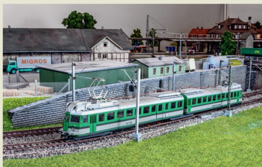
Natürlich fehlt auch der BDe 4/6 103 nicht im Modellfuhrpark.