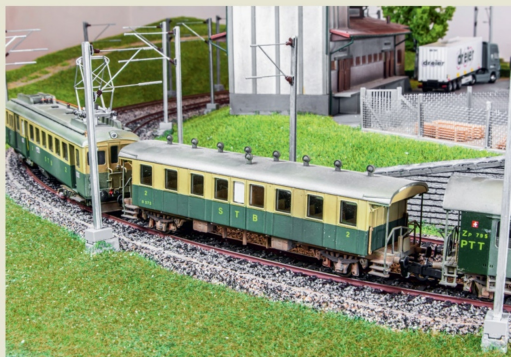
Beim B 575 handelt es sich um ein abgeändertes Liliput-Modell.