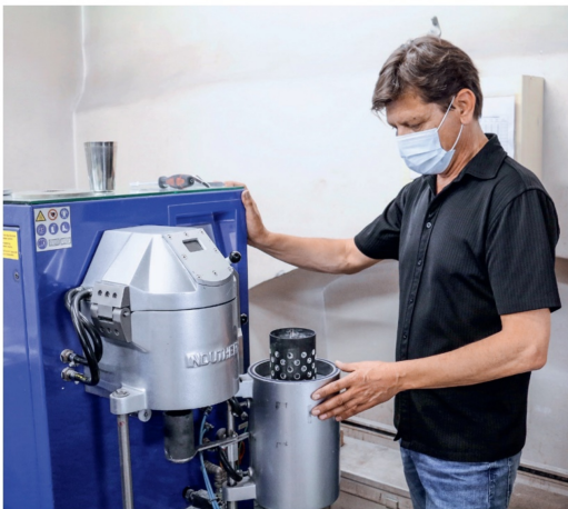
Die heissen Gusstiegel werden in die Vakuumgussmaschine eingesetzt.