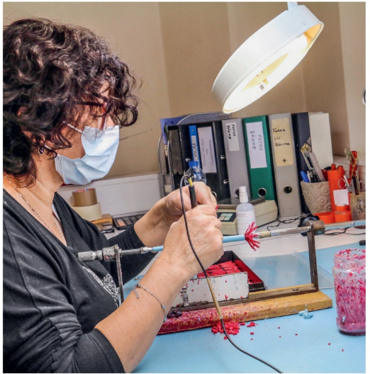
Die Wachsteile werden von Hand zu einem Gussbaum zusammengelötet.