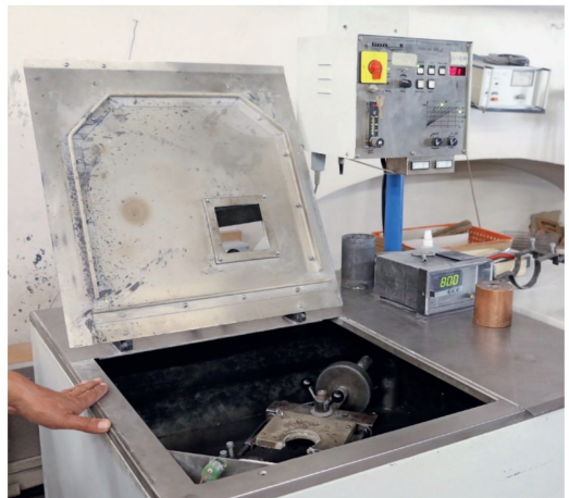
Blick in eine Schleudergussmaschine, die ebenfalls verwendet wird.